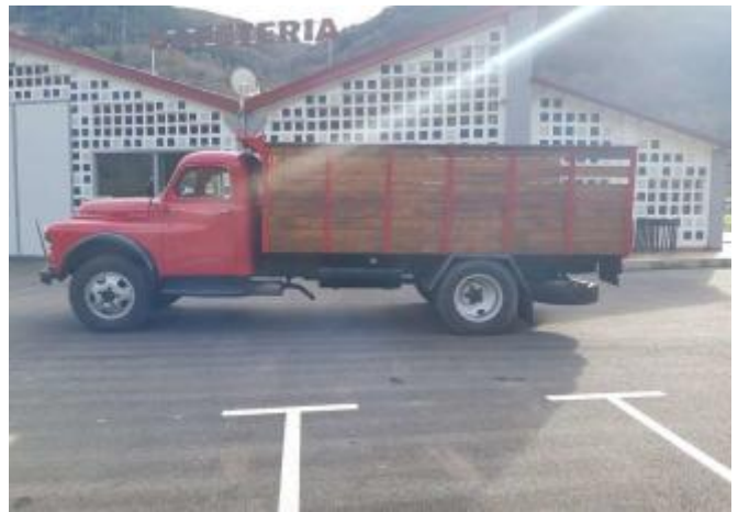
Camión Dodge de 1940, nuevo en el museo de Selviella.

El museo "Las Ayalgas" de Selviella (Belmonte de Miranda) no para de crecer desde su apertura el pasado verano. Tras un descanso invernal, la colección impulsada por el empresario tinetense Ángel Menéndez Rubio, más conocido como Ángel Forcón, abre de nuevo sus puertas con novedades a exposición como un camión de los años cuarenta del pasado siglo, dos tractores de principios del XX y una creación para convertir dos piedras en un pisón de escanda. El taller de reparación con el que cuenta el espacio no para de trabajar. Todo para atraer visitantes al concejo y dar una utilidad al "tesoro" acumulado durante años por Forcón.